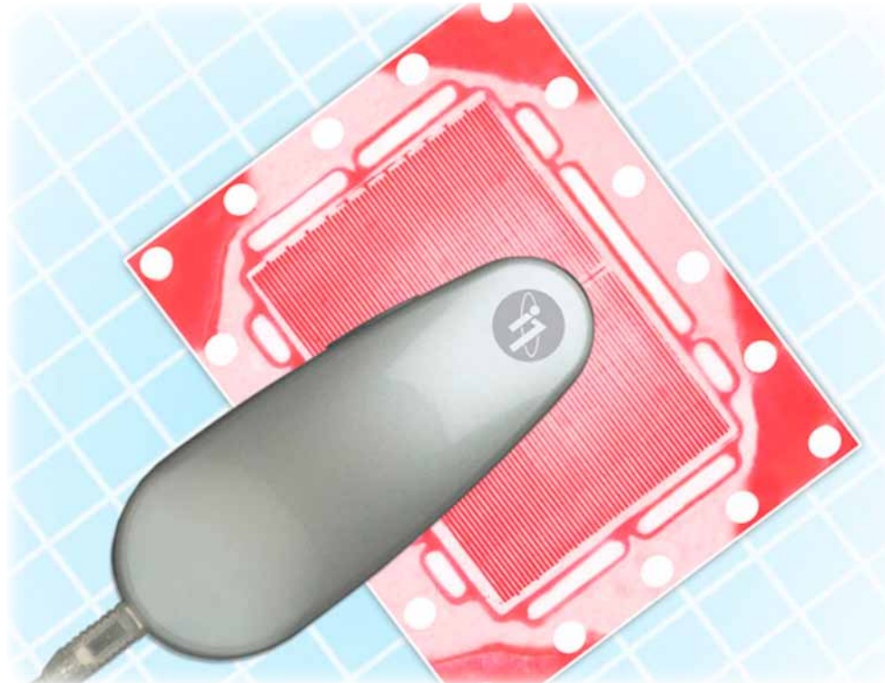
PointScan®-Gerät, aufgenommen auf einem den Druck anzeigenden Filmbild einer Brennstoffzelle.

Mit Blick auf die gesamte Wirtschaft ergänzt er: „Wir glauben, daß wir den Beginn einer Konjunkturerholung sehen, allerdings nicht vor Ende des Jahres. Wir hoffen und erwarten dabei, daß einige unserer Kunden wieder ihr Leistungsvermögen erreichen. Allerdings